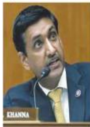
है। रो खान ने एक अन्य ट्वीट में कहा, 'भारतीय लोकतंत्र के हित और से सुनाई गई सजा का मामला खूब तक पहुंच चुका है।

जेनेवा। कांग्रेस नेता राहुल गांधी की सजा और फिर लोकसभा सदस्यता जाने के मुद्दे पर जहां भारत में पुर विवाद बिकर गया है, वहीं इसे लेकर अब संयुक्त राष्ट्र से लेकर अमेरिकी संसद तक के बयान सामने आए हैं। भारतीय मूल के प्रभावशाली अमेरिकी संसद रो खान ने राहुल गांधी को लोकसभा सदस्यता से अयोग्य घोषित किए जाने के फैसले को 'गांधीवादी विचारधारा के साथ 'गहरा विश्वासघात' करार दे दिया। क्या बोले अमेरिकी संसद? रो खान ने ट्वीट किया, 'राहुल गांधी को संसद की सदस्यता से अयोग्य ठहराया जाना गांधीवादी दर्शन और भारत के गहरे मूल्यों के साथ गहरा विश्वासघात है।' उन्होंने कहा, यह वह नहीं है, जिसके लिए मेरे दादाजी ने अपनी जिंदगी के कई साल जेल में कुर्बान कर दिए थे। रो खान अमेरिका की प्रतिनिधि सभा में सिलिकॉन वैली का प्रतिनिधित्व करते हैं। वह भारत और भारतीय-अमेरिकियों पर अमेरिकी संसद के कामकाज के सह-अध्यक्ष हैं। उन्होंने प्रधानमंत्री नरेंद्र मोदी से इस मामले में हस्तक्षेप करने का अनुरोध किया