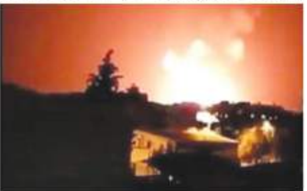
समर्थित ताकतों ने भी इन हमलों के बाद एक ऑनलाइन बयान में कहा कि उनके साथ बहुत लंबे हैं और वह अमेरिका के ठिकानों पर हमला करने की तावत रखते हैं। इसके बाद अमेरिका ने जवाबी कार्रवाई की है। सीरिया में ही जवाब देते हुए अमेरिका ने ईरानी

वाशिंगटन। अमेरिका और ईरानी लड़ाकों के बीच जंग का मैदान सीरिया बन रहा है। सीरिया में अमेरिकी ठिकाने पर ड्रोन हमले में एक अमेरिकी काट्रेक्टर की मौत के बाद अमेरिका ने सीरिया पर बम बरसाए। ईरानी लड़ाकों पर एयर स्ट्राइक के बाद अमेरिका के राष्ट्रपति जो बाइडन ने ईरान को चेतावनी भी दी है। बाइडन ने कहा है कि वह अमेरिकी नागरिकों को बचाने के लिए कड़ी कार्रवाई करेगा। सीरिया में अमेरिका व ईरानी लड़ाकों के बीच घमासान जारी है। सीरिया स्थित अमेरिकी सेना के एक शिविर पर ड्रोन हमले में एक अमेरिकी काट्रेक्टर की मौत हो गयी थी और पांच अमेरिकी सैनिक घायल हो गए थे। इसके तुरंत बाद अमेरिकी के अन्य शिविर पर मिसाइल हमला भी हुआ, किन्तु इस मिसाइल हमले में किसी के हताहत होने की जानकारी सामने नहीं आई है। अमेरिका ने ईरान समर्थित ताकतों को इन हमलों के लिए जिम्मेदार बताया था। ईरान लड़ाकों के ठिकानों पर हवाई हमला किया। अमेरिका के एफ-15 लड़ाकू विमानों ने ईरान के