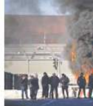
वाणिज्यिक बंदरगाह तक ट्रकों की कतारें लग गईं। वहीं, देश में हुए कर्मी व अन्य अधिकारी घायल हो गए। उन्होंने बताया कि एक दिन बाद नॉरपेडी स्थित रिफाइनरी में तेल की अपूर्ति शुक्रवार को बहाल हुई। गौरतलब है कि फ्रांस के राष्ट्रपति एमैनुएल मैक्रों ने प्रधानमंत्री एलिजाबेथ बोर्न को विशेष संवैधानिक शक्ति का उपयोग करने का आदेश दिया था। उनके इस आदेश के बाद संसद को संवैधानिक शक्ति की आयु 62 से बढ़ाकर 64 करने के अति विवादित विधेयक को बिना मतदान के मंजूरी देने के लिए विवश किया गया था। रिपोर्ट्स के अनुसार पेंशन विवाद को लेकर विरोध प्रदर्शन के जरिए प्रदर्शनकारी अपनी अत्याज फुल्लाना चाहते हैं क्योंकि दूसरे किसी तरीके से ये सुधार वापस नहीं लिया जाएगा। विरोध प्रदर्शन के चलते रेल यातायात और तेल रिफाइनरी का काम प्रभावित हुआ और कुछ लोगों को चोटें भी आईं।

पेरिस। फ्रांस में पेंशन के मुद्दे को लेकर विरोध प्रदर्शन बढ़ने के साथ हिंसक होना जा रहा है। विरोध प्रदर्शन के बीच 441 पुलिस कर्मी व अन्य अधिकारी भी घायल हो गए। वहीं 450 से अधिक प्रदर्शनकारियों को गिरफ्तार किया गया। प्रदर्शनकारियों ने बोटों टाउन हॉल में आग लगी दी। गृह मंत्रालय के आंकड़ों के मुताबिक गुरुवार को फ्रांस में करीब 10 लाख लोगों ने सड़क पर उतरकर विरोध प्रदर्शन में हिस्सा लिया। वहीं राजधानी पेरिस में करीब 1 लाख 19 हजार लोग प्रदर्शन में शामिल हुए। फ्रांस के राष्ट्रपति एमैनुएल मैक्रों के पेंशन सुधारों को लेकर देश में अलग-अलग स्थानों पर प्रदर्शन जारी रहा, जिसके कारण ट्रेन यातायात बाधित हुआ, मार्सिले के