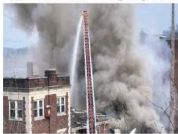
हिस्सा गिर गया और छड़े हिस्से को नुकसान पहुंचा। पुलिस के लोग लापता हैं। जिनकी तलाश की जा रही है। विस्फोट के कारण

वाशिंगटन। अमेरिका के पेनसिल्वेनिया प्रांत की एक चॉकलेट फैक्ट्री में हुए जोरदार विस्फोट में दो लोगों की मौत हो गयी। हदसे में घायल आठ लोगों को अस्पताल में भर्ती कराया गया है, जिनमें से दो की हालत गंभीर है। घटना के बाद नौ लोग लापता बताए जा रहे हैं। घटनास्थल पर राहत कार्य जारी है। पुलिस लापता लोगों को तलाशने के साथ मामले की जांच कर रही है। जानकारी के मुताबिक पेनसिल्वेनिया के वेस्ट रीडिंग क्षेत्र में आरएम फ्लोर कंपनी का चॉकलेट उत्पादन संयंत्र लगा है। पेनसिल्वेनिया पुलिस के वेस्ट रीडिंग क्षेत्र के प्रमुख ने बताया कि शाम 4.57 बजे अचानक तेज