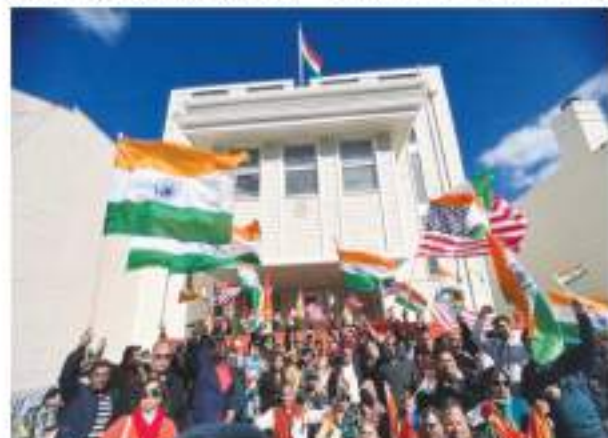
भारतीय वाणिज्य दूतावास तक पहुंचे। इन लोगों ने अलगाववादी सिद्धों की गतिविधियों की निंदा की। मौके पर किसी भी अश्रिय घटना को रोकने के लिए बड़ी संख्या में स्थानीय पुलिस मौजूद थी। इस दौरान वहाँ पहुंचे कुछ अलगाववादी सिद्धों ने खालिस्तान के समर्थन में नारे लगाए, लेकिन बड़ी संख्या में भारतीय अमेरिकियों ने 'वंदे मातरम' के नारे लगाए और अमेरिका के साथ भारतीय गण्टी भोज लहराया। भारतीय-अमेरिकी भारत के पक्ष में नारे लगा रहे थे।

सैन फ्रांसिस्को। अमेरिका के सैन फ्रांसिस्को स्थित भारत के वाणिज्य दूतावास पर खालिस्तान समर्थकों के हमलों के विरोध में भारतीय अमेरिकी समुदाय ने रैली निकाली। रैली में शामिल लोग भारत के साथ एकजुटता का संदेश दे रहे थे। अमेरिका के सैन फ्रांसिस्को स्थित भारतीय वाणिज्य दूतावास के बाहर खालिस्तान समर्थक अलगाववादियों ने तोड़फोड़ की थी। खालिस्तान के समर्थन में नारे लगाते हुए प्रदर्शनकारियों ने पुलिस की ओर से लगाए गए अस्थायी सुरक्षा अवरोधकों को तोड़ दिया था और वाणिज्य दूतावास परिसर के अंदर दो तथ्यांकित खालिस्तानी झंडे लगा दिए थे। हालांकि वाणिज्य दूतावास के दो कर्मियों ने जल्द ही इन झंडों को हटा दिया। इसी घटना के विरोध में भारत के साथ एकजुटता दिखाने के लिए बड़ी संख्या में भारतीय-अमेरिकियों ने