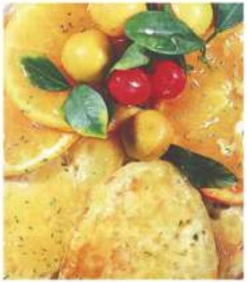
डाल कर फैलाएँ। दोनों ओर से सेंकें और ताजा अर्रिज सॉस के साथ परोसें।

सामग्री पैन केक के लिए : 1 कप मैदा, 2 बड़े चम्मच बटर, 1/2 कप दूध, छोटा चम्मच अर्रिज रिंड और 1/4 छोटा चम्मच सोडा बाइकार्बोनेट। सामग्री अर्रिज सॉस के लिए : 1 कप अर्रिज जूस, 1 छोटा चम्मच कॉर्नफ्लोर, 1 छोटा चम्मच चीनी, 1 छोटा चम्मच शहद, थोड़े से अर्रिज स्लाइस, थोड़ी-सी चैरी और 1/2 छोटा चम्मच अर्रिज रिंड (सेंतरे के छिलके का सफेद भाग खुरच कर निकाल दें व छिलका बारीक काटें)। विधि : सॉस की सभी सामग्री मिलाएँ और गाढ़ा होने तक फकाएँ। पैन केक की सामग्री मिलाएँ। पैन में बटर गर्म करें, एक कलाखी से पैन केक का मिश्रण