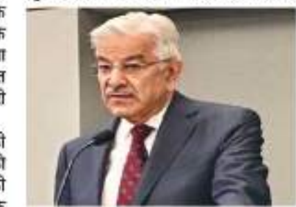
खैबर पख्तूनख्वा में चुनाव होने थे लेकिन अब चुनाव आयोग ने पंजाब में होने वाले प्रांतीय चुनाव को स्थगित करने का आदेश दिया है। देश में कानून व्यवस्था की खराब स्थिति का हवाला देते हुए चुनाव आयोग ने यह कदम उठाया है। जिसका इमरान खान की पार्टी द्वारा

इस्लामाबाद। पाकिस्तान के पूर्व प्रधानमंत्री इमरान खान की पार्टी पाकिस्तान तहरीक-ए-इंसाफ द्वारा जल्दी चुनाव कराने के लिए चल रहे आंदोलन के बीच पाकिस्तान के रक्षा मंत्री खान आसिफ ने बड़ा बयान दिया है। उन्होंने कहा है कि पाकिस्तान के वित्त मंत्रालय के पास चुनाव कराने के लिए जरूरी धन नहीं है। पाकिस्तान की तहरीक ए इंसाफ पार्टी की तत्कालीन सरकारों ने 14 और 18 जनवरी को पंजाब और खैबर पख्तूनख्वा प्रांतों की विधानसभाओं को भंग कर दिया था। इसके बाद एक मंच को पाकिस्तान के सुप्रीम कोर्ट ने विधानसभा भंग होने के 90 दिनों के भीतर दोनों राज्यों में चुनाव कराने का आदेश दिया था। इसके तहत अखिल में पंजाब और मई में